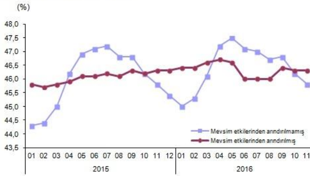
İstihdam oranı, Kasım 2016