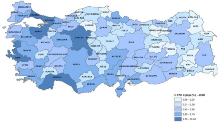
İl bazında GSYH payı, cari fiyatlarla, 2020

İl düzeyinde cari fiyatlarla GSYH hesaplamalarına göre; 2020 yılında İstanbul 1 trilyon 517 milyar 324 milyon TL ile en yüksek GSYH'ye ulaştı ve toplam GSYH'den %30,1 pay aldı. İstanbul'u, 482 milyar 589 milyon TL ve %9,6 pay ile Ankara, 306 milyar 713 milyon TL ve %6,1 pay ile İzmir izledi. İl düzeyinde GSYH hesaplarında son üç sırada 5 milyar 65 milyon TL ile Tunceli, 4 milyar 487 milyon TL ile Ardahan ve 3 milyar 191 milyon TL ile Bayburt yer aldı. GSYH'den en yüksek payı alan ilk beş il, 2020 yılında toplam GSYH'nin %53,5'ini oluşturdu.