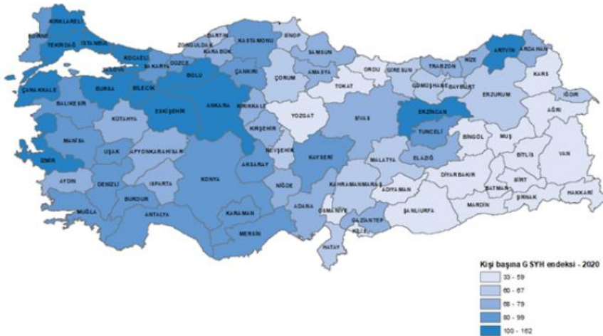
İl bazında kişi başına GSYH endeksi, cari fiyatlarla, 2020 [Türkiye=100]

Kişi başına GSYH, 2020 yılında on dört il için Türkiye ortalamasının üzerinde gerçekleşti.