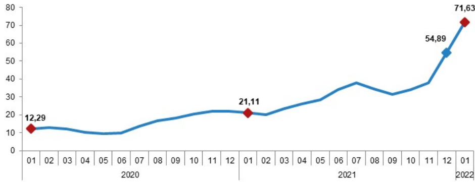
H-ÜFE yıllık değişim oranı (%), Ocak 2022