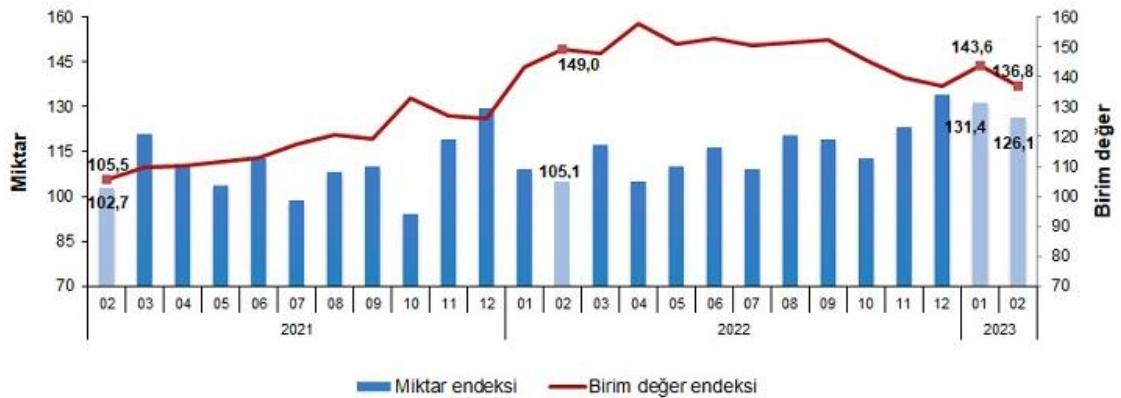
İthalat birim değer ve miktar endeksleri, Şubat 2023 [2015=100]

İthalat miktar endeksi Şubat ayında bir önceki yılın aynı ayına göre %20,0 arttı. Endeks bir önceki yılın aynı ayına göre, gıda, içecek ve tütünde %30,0, yakıtlarda %16,6 ve imalat sanayinde (gıda, içecek, tütün hariç) %6,5 artarken, ham maddelerde (yakıt hariç) %20,5 azaldı.