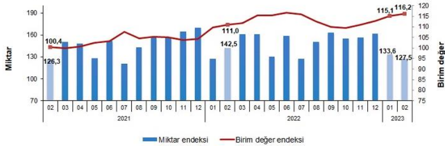
İhracat birim değer ve miktar endeksleri, Şubat 2023 [2015=100]

İhracat miktar endeksi Şubat ayında bir önceki yılın aynı ayına göre %10,5 azaldı. Endeks bir önceki yılın aynı ayına göre, gıda, içecek ve tütünde %18,5, ham maddelerde (yakıt hariç) %11,5 ve imalat sanayinde (gıda, içecek, tütün hariç) %11,5 azalırken, yakıtlarda %15,8 arttı.