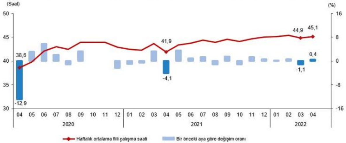
Mevsim ve takvim etkilerinden arındırılmış haftalık ortalama fiili çalışma süresi, Nisan 2020-Nisan 2022

İstihdam edilenlerden referans döneminde işbaşında olanların, mevsim ve takvim etkilerinden arındırılmış haftalık ortalama fiili çalışma süresi 2022 yılı Nisan ayında bir önceki aya göre 0,2 saat artarak 45,1 saat olarak gerçekleşti.