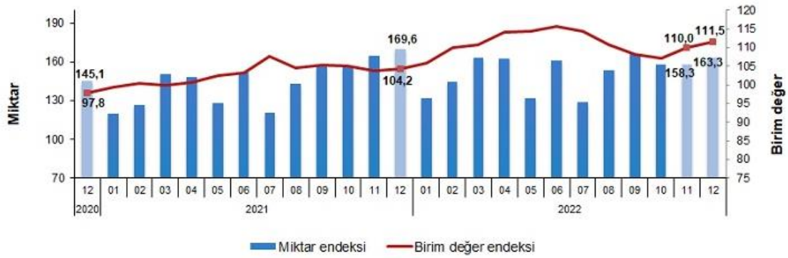
İhracat birim değer ve miktar endeksleri, Aralık 2022 [2015=100]

İhracat miktar endeksi 2022 yılı dördüncü çeyrekte bir önceki yılın dördüncü çeyreğine göre %2,1 azaldı. Endeks, 2022 yılında bir önceki yıla göre %4,8 arttı.