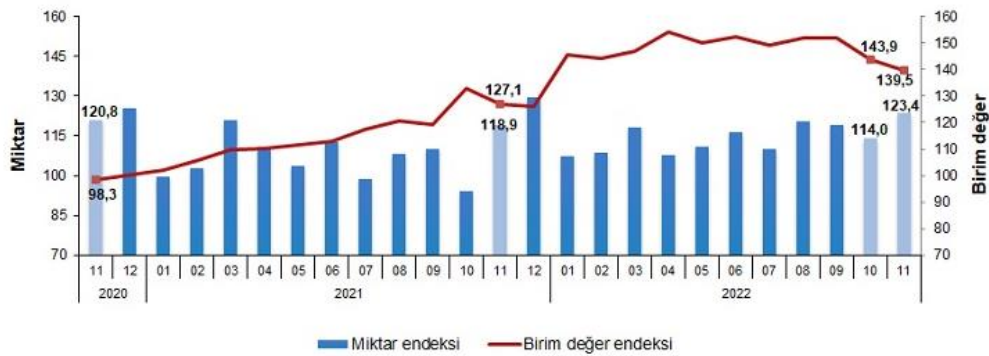
İthalat birim değer ve miktar endeksleri, Kasım 2022 [2015=100]

İthalat miktar endeksi Kasım ayında bir önceki yılın aynı ayına göre %3,8 arttı. Endeks bir önceki yılın aynı ayına göre, gıda, içecek ve tütünde %13,0 ve imalat sanayinde (gıda, içecek, tütün hariç) %3,8 artarken, ham maddelerde (yakıt hariç) %19,3 ve yakıtlarda %15,8 azaldı.