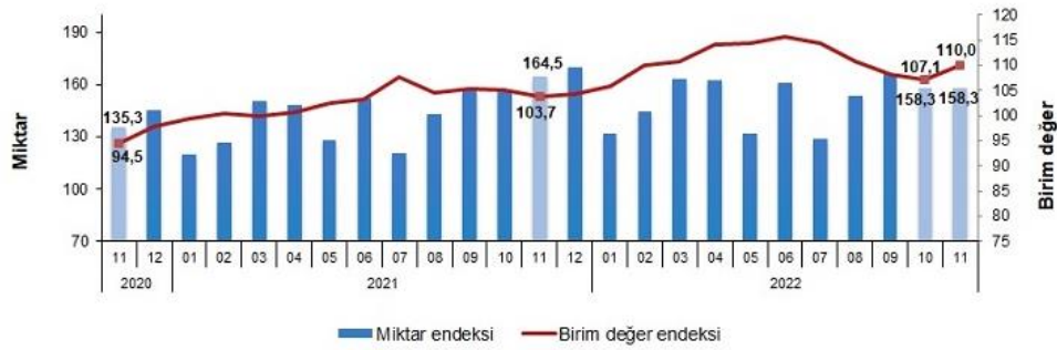
İhracat birim değer ve miktar endeksleri, Kasım 2022 [2015=100]

İhracat miktar endeksi Kasım ayında bir önceki yılın aynı ayına göre %3,8 azaldı. Endeks bir önceki yılın aynı ayına göre, gıda, içecek ve tütünde %0,2 ve imalat sanayinde (gıda, içecek, tütün hariç) %2,5 azalırken, ham maddelerde (yakıt hariç) %9,0 ve yakıtlarda %3,5 arttı.