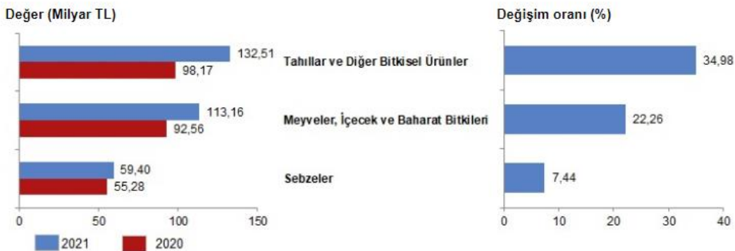
Gruplara göre bitkisel üretim değeri ve yıllık değişim oranları, 2021

Meyveler, içecek ve baharat bitkileri üretim değeri bir önceki yıla göre %22,26 artışla 113,16 milyar TL ve sebzeler üretim değeri bir önceki yıla göre %7,44 artışla 59,40 milyar TL oldu