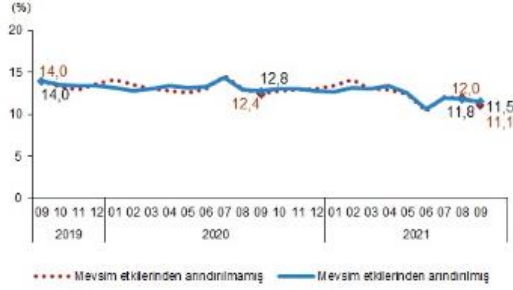
İşsizlik oranı, Eylül 2019-Eylül 2021