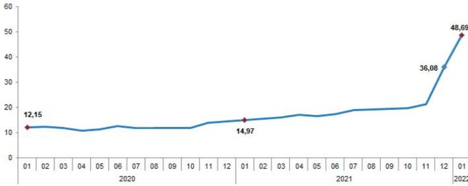
TÜFE yıllık değişim oranları (%), Ocak 2022