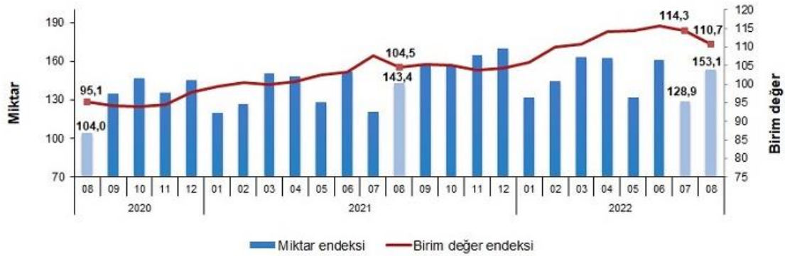
İhracat birim değer ve miktar endeksleri, Ağustos 2022 [2015=100]

İhracat miktar endeksi Ağustos ayında bir önceki yılın aynı ayına göre %6,8 arttı. Endeks bir önceki yılın aynı ayına göre, gıda, içecek ve tütünde %7,6, ham maddelerde (yakıt hariç) %20,6, yakıtlarda %39,6 ve imalat sanayinde (gıda, içecek, tütün hariç) %4,7 arttı.