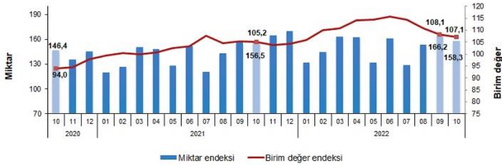
İhracat birim değer ve miktar endeksleri, Ekim 2022 [2015=100]

İhracat miktar endeksi Ekim ayında bir önceki yılın aynı ayına göre %1,1 arttı. Endeks bir önceki yılın aynı ayına göre, gıda, içecek ve tütünde %2,2 azalırken, ham maddelerde (yakıt hariç) %18,5, yakıtlarda %29,5 ve imalat sanayinde (gıda, içecek, tütün hariç) %0,1 arttı.