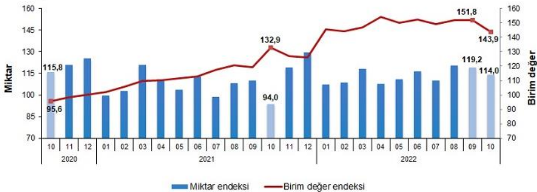
İthalat birim değer ve miktar endeksleri, Ekim 2022 [2015=100]

İthalat miktar endeksi Ekim ayında bir önceki yılın aynı ayına göre %21,3 arttı. Endeks bir önceki yılın aynı ayına göre, gıda, içecek ve tütünde %9,0, ham maddelerde (yakıt hariç) %18,5, yakıtlarda %1,3 ve imalat sanayinde (gıda, içecek, tütün hariç) %15,2 arttı.