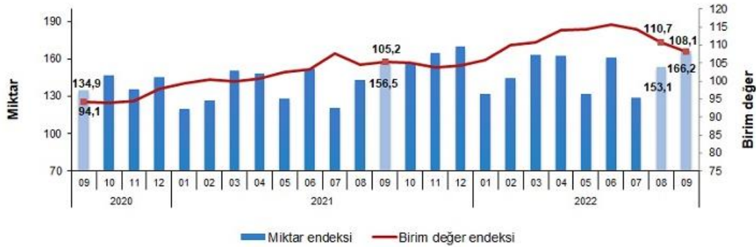
İhracat birim değer ve miktar endeksleri, Eylül 2022 [2015=100]

İhracat miktar endeksi 2022 yılı üçüncü çeyrekte bir önceki yılın üçüncü çeyreğine göre %7,2 arttı.