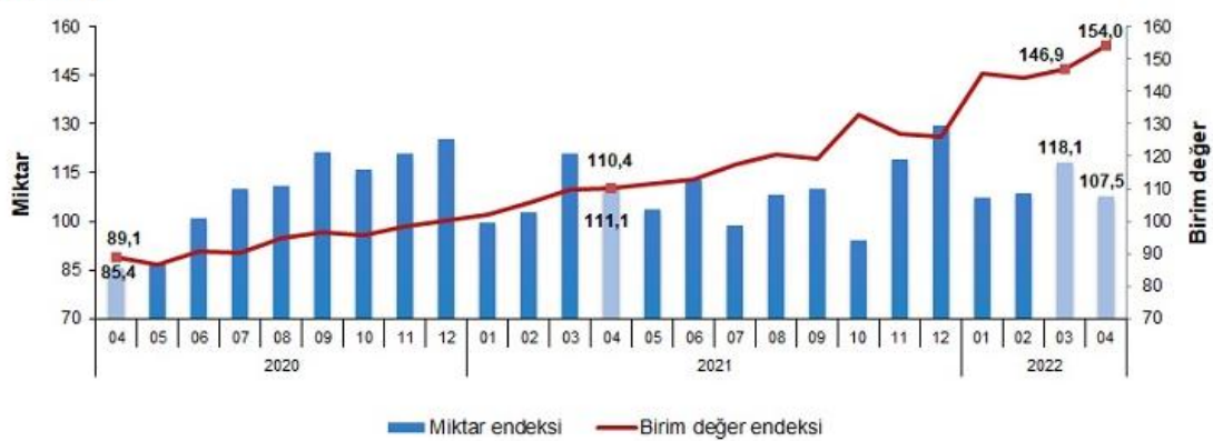
İthalat birim değer ve miktar endeksleri, Nisan 2022 [2015=100]

İthalat miktar endeksi Nisan ayında bir önceki yılın aynı ayına göre %3,2 azaldı. Endeks bir önceki yılın aynı ayına göre, gıda, içecek ve tütünde %19,4 ve imalat sanayinde (gıda, içecek, tütün hariç) %3,6 artarken, ham maddelerde (yakıt hariç) %5,4 ve yakıtlarda %20,2 azaldı.