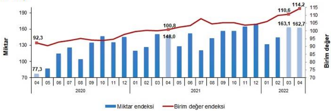
İhracat birim değer ve miktar endeksleri, Nisan 2022 [2015=100]

İhracat miktar endeksi Nisan ayında bir önceki yılın aynı ayına göre %10,0 arttı. Endeks bir önceki yılın aynı ayına göre, gıda, içecek ve tütünde %8,2, ham maddelerde (yakıt hariç) %9,1, yakıtlarda %25,1 ve imalat sanayinde (gıda, içecek, tütün hariç) %11,4 arttı.