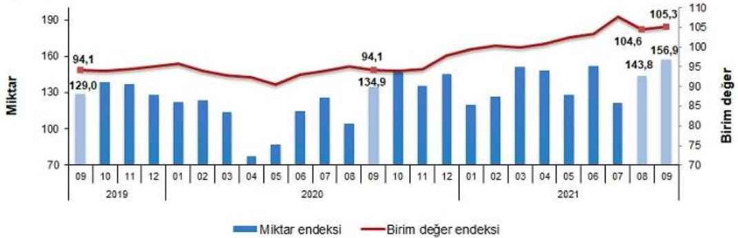
İhracat birim değer ve miktar endeksleri, Eylül 2021 [2015=100]

İhracat miktar endeksi 2021 yılı üçüncü çeyrekte bir önceki yılın üçüncü çeyreğine göre %15,0 arttı.