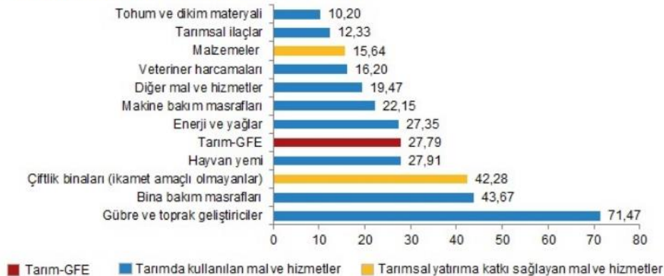
Alt gruplara göre Tarım-GFE yıllık değişim oranı (%), Eylül 2021

Yıllık artışın düşük olduğu alt gruplar sırasıyla, %10,20 ile tohum ve dikim materyali, %12,33 ile tarımsal ilaçlar ve %15,64 ile malzemeler oldu. Buna karşılık, yıllık artışın yüksek olduğu alt gruplar ise sırasıyla, %71,47 ile gübre ve toprak geliştiriciler, %43,67 ile bina bakım masrafları ve %42,28 ile çiftlik binaları (ikamet amaçlı olmayanlar) oldu.