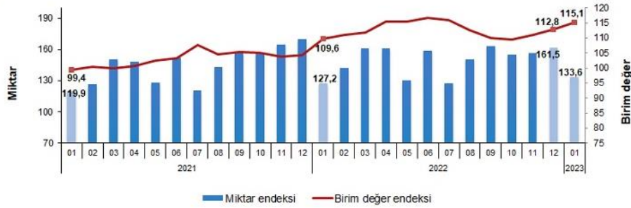
İhracat birim değer ve miktar endeksleri, Ocak 2023 [2015=100]

İhracat miktar endeksi Ocak ayında bir önceki yılın aynı ayına göre %5,0 arttı. Endeks bir önceki yılın aynı ayına göre, gıda, içecek ve tütünde %2,2 azalırken, ham maddelerde (yakıt hariç) %16,5, yakıtlarda %32,7 ve imalat sanayinde (gıda, içecek, tütün hariç) %3,3 arttı.