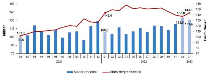
İthalat birim değer ve miktar endeksleri, Ocak 2023 [2015=100]

İthalat miktar endeksi Ocak ayında bir önceki yılın aynı ayına göre %20,5 arttı. Endeks bir önceki yılın aynı ayına göre, gıda, içecek ve tütünde %19,0, yakıtlarda %4,2 ve imalat sanayinde (gıda, içecek, tütün hariç) %11,7 artarken, ham maddelerde (yakıt hariç) %22,4 azaldı.