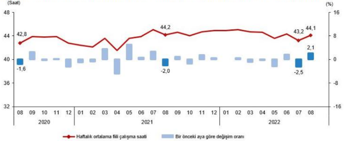
Mevsim ve takvim etkilerinden arındırılmış haftalık ortalama fiili çalışma süresi, Ağustos 2020-Ağustos 2022

İstihdam edilenlerden referans döneminde işbaşında olanların, mevsim ve takvim etkilerinden arındırılmış haftalık ortalama fiili çalışma süresi 2022 yılı Ağustos ayında bir önceki aya göre 0,9 saat artarak 44,1 saat olarak gerçekleşti.