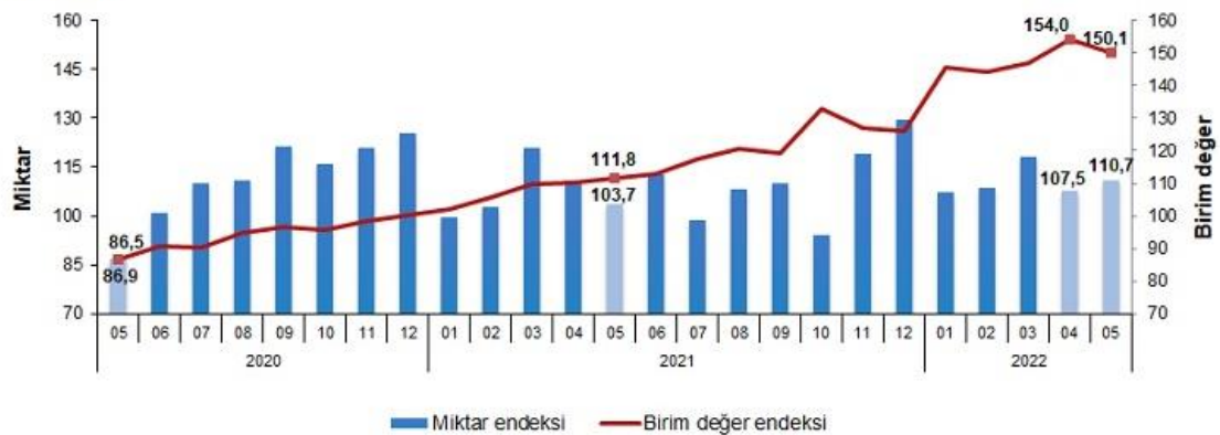
İthalat birim değer ve miktar endeksleri, Mayıs 2022 [2015=100]

İthalat miktar endeksi Mayıs ayında bir önceki yılın aynı ayına göre %6,8 arttı. Endeks bir önceki yılın aynı ayına göre, gıda, içecek ve tütünde %55,9, ham maddelerde (yakıt hariç) %4,1 ve imalat sanayinde (gıda, içecek, tütün hariç) %5,7 artarken, yakıtlarda %7,6 azaldı.