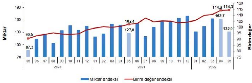
İhracat birim değer ve miktar endeksleri, Mayıs 2022 [2015=100]

İhracat miktar endeksi Mayıs ayında bir önceki yılın aynı ayına göre %3,3 arttı. Endeks bir önceki yılın aynı ayına göre, gıda, içecek ve tütünde %0,3, ham maddelerde (yakıt hariç) %8,2, yakıtlarda %0,5 ve imalat sanayinde (gıda, içecek, tütün hariç) %4,2 arttı.