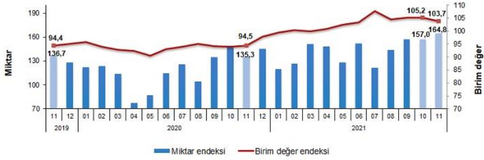
İhracat birim değer ve miktar endeksleri, Kasım 2021 [2015=100]

İhracat miktar endeksi Kasım ayında bir önceki yılın aynı ayına göre %21,8 arttı. Endeks bir önceki yılın aynı ayına göre, gıda, içecek ve tütünde %20,4, ham maddelerde (yakıt hariç) %18,0, yakıtlarda %34,4 ve imalat sanayinde (gıda, içecek, tütün hariç) %17,3 arttı.