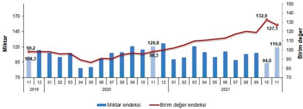
İthalat birim değer ve miktar endeksleri, Kasım 2021 [2015=100]

İthalat miktar endeksi Kasım ayında bir önceki yılın aynı ayına göre %1,5 azaldı. Endeks bir önceki yılın aynı ayına göre, gıda, içecek ve tütünde %14,6, ham maddelerde (yakıt hariç) %6,9, yakıtlarda %9,6 ve imalat sanayinde (gıda, içecek, tütün hariç) %5,1 arttı.