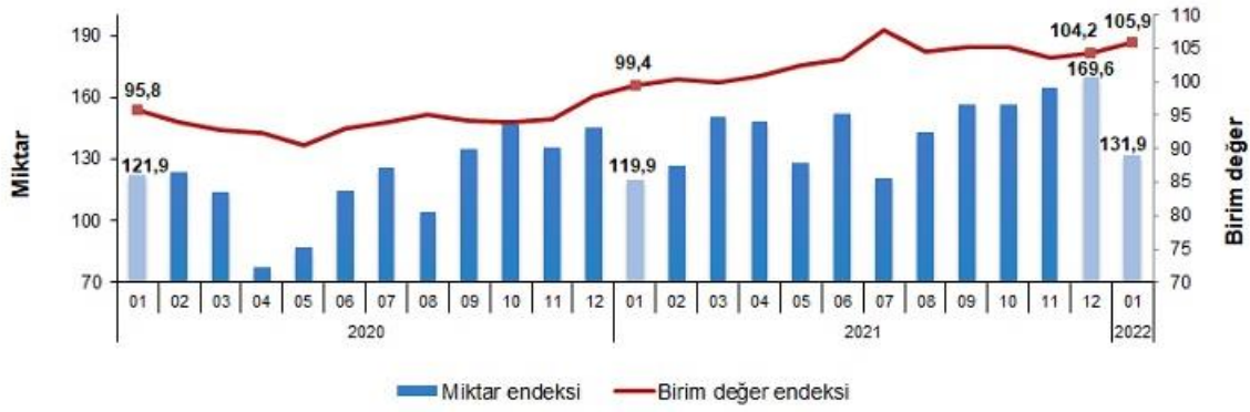
İhracat birim değer ve miktar endeksleri, Ocak 2022 [2015=100]

İhracat miktar endeksi Ocak ayında bir önceki yılın aynı ayına göre %10,0 arttı. Endeks bir önceki yılın aynı ayına göre, gıda, içecek ve tütünde %16,7, ham maddelerde (yakıt hariç) %23,3 ve imalat sanayinde (gıda, içecek, tütün hariç) %13,0 artarken, yakıtlarda %4,4 azaldı.