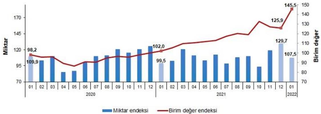
İthalat birim değer ve miktar endeksleri, Ocak 2022 [2015=100]

İthalat miktar endeksi Ocak ayında bir önceki yılın aynı ayına göre %8,1 arttı. Endeks bir önceki yılın aynı ayına göre, gıda, içecek ve tütünde %9,0, ham maddelerde (yakıt hariç) %12,4, yakıtlarda %6,1 ve imalat sanayinde (gıda, içecek, tütün hariç) %14,5 arttı.