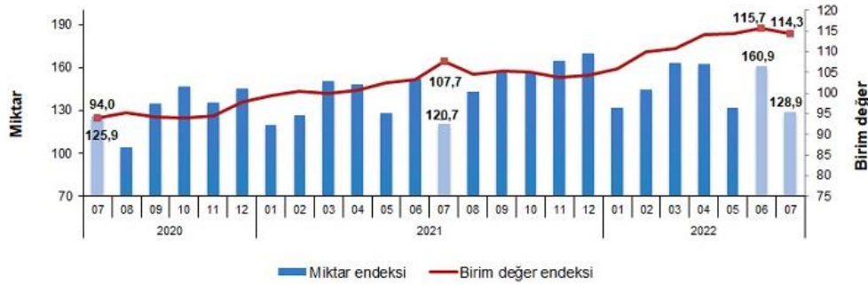
İhracat birim değer ve miktar endeksleri, Temmuz 2022 [2015=100]

İhracat miktar endeksi Temmuz ayında bir önceki yılın aynı ayına göre %6,8 arttı. Endeks bir önceki yılın aynı ayına göre, gıda, içecek ve tütünde %22,3, ham maddelerde (yakıt hariç) %14,2, yakıtlarda %52,7 ve imalat sanayinde (gıda, içecek, tütün hariç) %1,4 arttı.