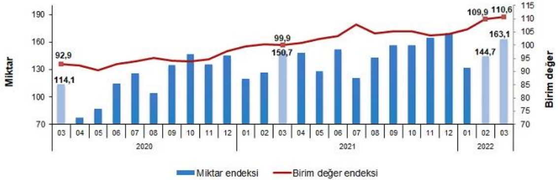
İhracat birim değer ve miktar endeksleri, Mart 2022 [2015=100]

İhracat miktar endeksi 2022 yılı birinci çeyrekte bir önceki yılın birinci çeyreğine göre %10,4 arttı.