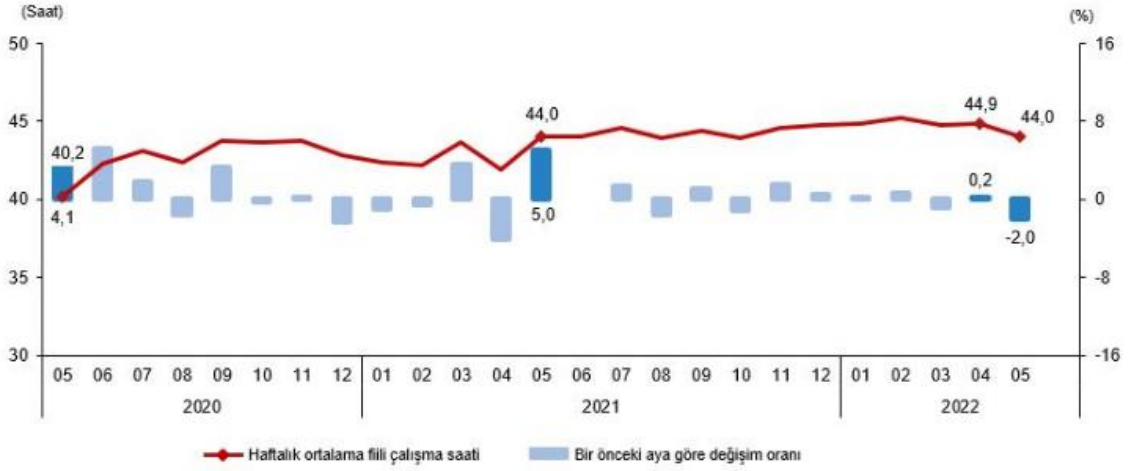
Mevsim ve takvim etkilerinden arındırılmış haftalık ortalama fiili çalışma süresi, Mayıs 2020-Mayıs 2022

İstihdam edilenlerden referans döneminde işbaşında olanların, mevsim ve takvim etkilerinden arındırılmış haftalık ortalama fiili çalışma süresi 2022 yılı Mayıs ayında bir önceki aya göre 0,9 saat azalarak 44,0 saat olarak gerçekleşti.