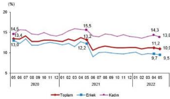
İşsizlik oranı, Mayıs 2020-Mayıs 2022