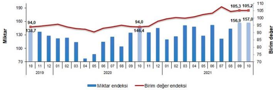
İhracat birim değer ve miktar endeksleri, Ekim 2021 [2015=100]

İhracat miktar endeksi Ekim ayında bir önceki yılın aynı ayına göre %7,3 arttı. Endeks bir önceki yılın aynı ayına göre, gıda, içecek ve tütünde %8,8, ham maddelerde (yakıt hariç) %10,1 ve imalat sanayinde (gıda, içecek, tütün hariç) %8,6 artarken, yakıtlarda %8,8 azaldı.