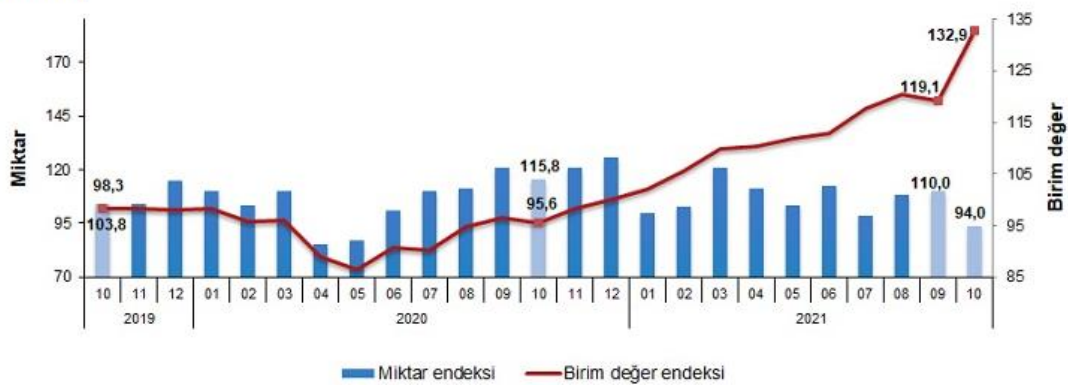
İthalat birim değer ve miktar endeksleri, Ekim 2021 [2015=100]

İthalat miktar endeksi Ekim ayında bir önceki yılın aynı ayına göre %18,8 azaldı. Endeks bir önceki yılın aynı ayına göre, gıda, içecek ve tütünde %6,9 artarken, ham maddelerde (yakıt hariç) %17,5, yakıtlarda %8,7 ve imalat sanayinde (gıda, içecek, tütün hariç) %14,4 azaldı.