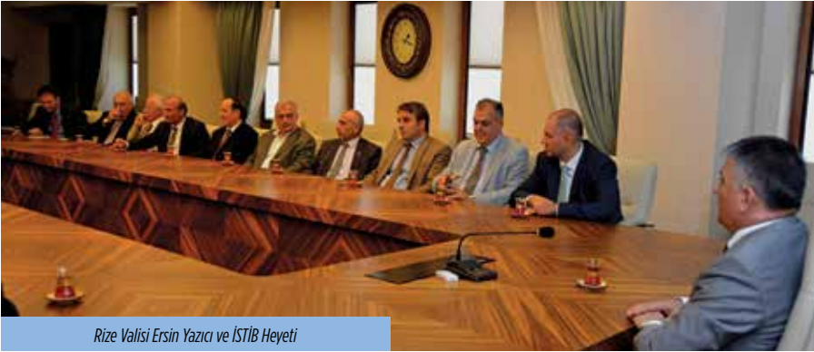
Rize Valisi Ersin Yazıcı ve İSTİB Heyeti