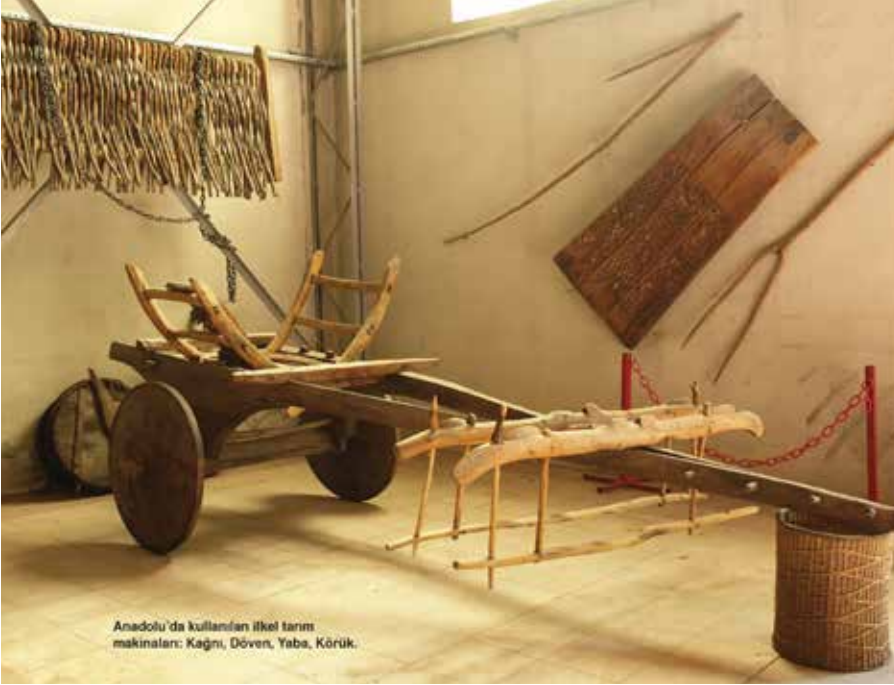
Anadolu'da kullanılan ilkel tarım makineleri: Kağı, Döven, Yaba, Körük.