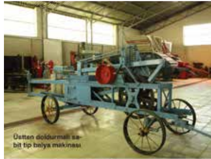
Üstten doldurulan sabit tip buğaya makinası

Peki, Türkiye'nin tarımsal geçmişinin izini, arşivin tozlu rafları dışında nerelerde sürebiliriz? İşte bu sorunun çok önemli cevabını Ege Üniversitesi veriyor. Ege Üniversitesi'nin Ziraat Fakültesi Tarım Makinaları ve Teknolojileri Mühendisliği Bölümü, tarımda makineleşmeye önderlik eden Atatürk'ün doğumunun 100. yılı münasebetiyle Türkiye'nin ilk