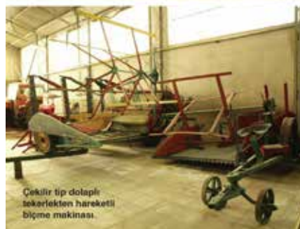
Çekülür tip dolaplı tekerlekten hareketli biçme makinası

tarım aletleri müzesini kurmuştu. Hem de 1980'li yılların hemen başında... Böylece yabancı ülkelerde neredeyse her şehirde rastlanan ticaret müzesi, tarım müzesi, para müzesi gibi ekonomik kalkınmayı gösteren müzelere Türkiye adına çok önemli bir başlangıç yapmıştı.