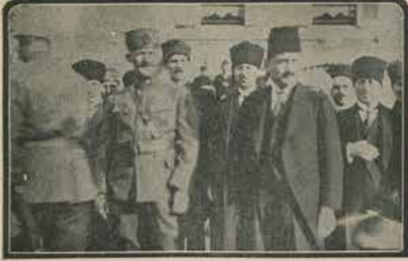
Şükrü Naili Paşa Heyet-i Mebusa arasında