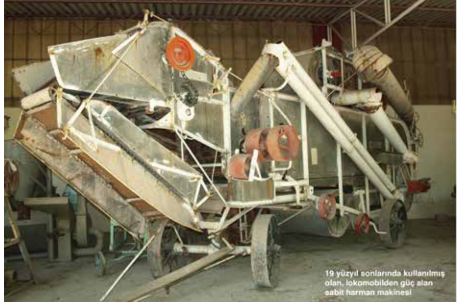
19 yüzyıl sonlarında kullanılmış olan, lokomobilden güç alan sabit harman makinesi

“Müze, genç mühendis adaylarının, konuyla ilgili çalışan akademisyen ve araştırmacıların ve ilgili sektörde faaliyet gösteren üreticilerin bir referans noktasıdır. Geçen 30 yıl boyunca bu misyonunu vazgeçmeden sürdürmüş ve gelişen vizyonuyla ülkesine hizmet vermeye devam etmektedir.”