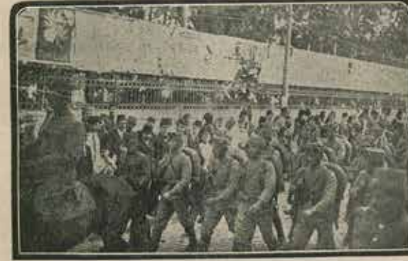
Taksim Kışlası önünde: Geçit resminden bir safha