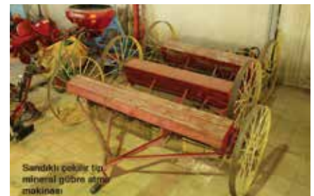
Sandıklı çakır türü mineral gübre simi makinesi

1900’lerin hemen başında yapılan bir harman makinesi ise JI Case Company tarafından ABD’nin Wisconsin eyaletinde üretilmişti. Müzedede sergilenen bu harman makinesi günümüz biçerdöverlerinin atası olarak kabul edilir. Lokomobilden kayış kasnak yardımıyla aldığı gücü iş yapmak için kullanır. Çakmak, harman makinesinin yaptığı işi ise, “ekinin başağındaki daneleri ayırıp elemek ve çıkan samanı dışarı savurmak” şeklinde açıklıyor.