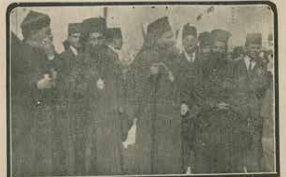
İstikbal intibaâtından: Papa Effime Hahambaşı, Rum ve Ermeni Patrik Kaimmakamları