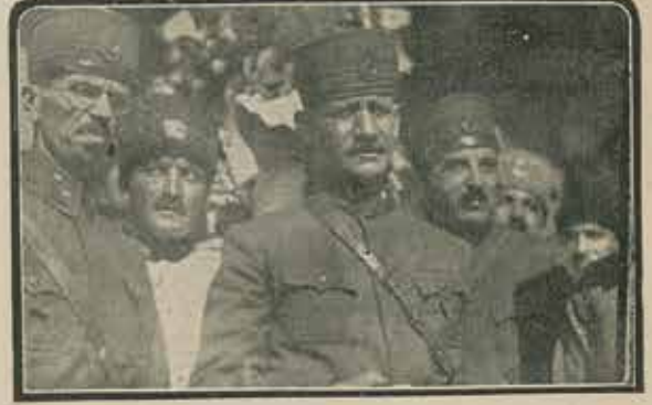
Kumandan Şükrü Naili Paşa ve Kolordu Erkânı