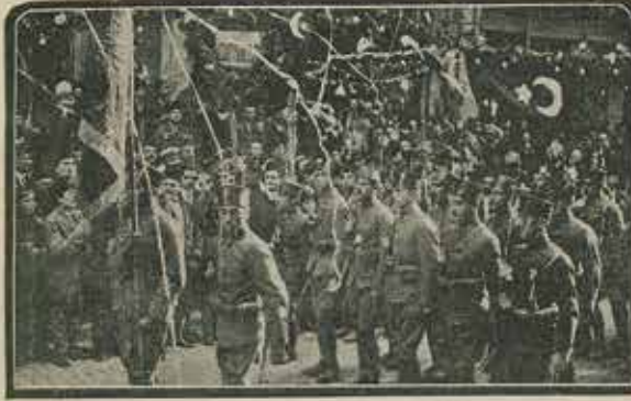
Beyoğlu'nun şenlikleri: Askerlerimizin üstüne serpantinler dökülürken