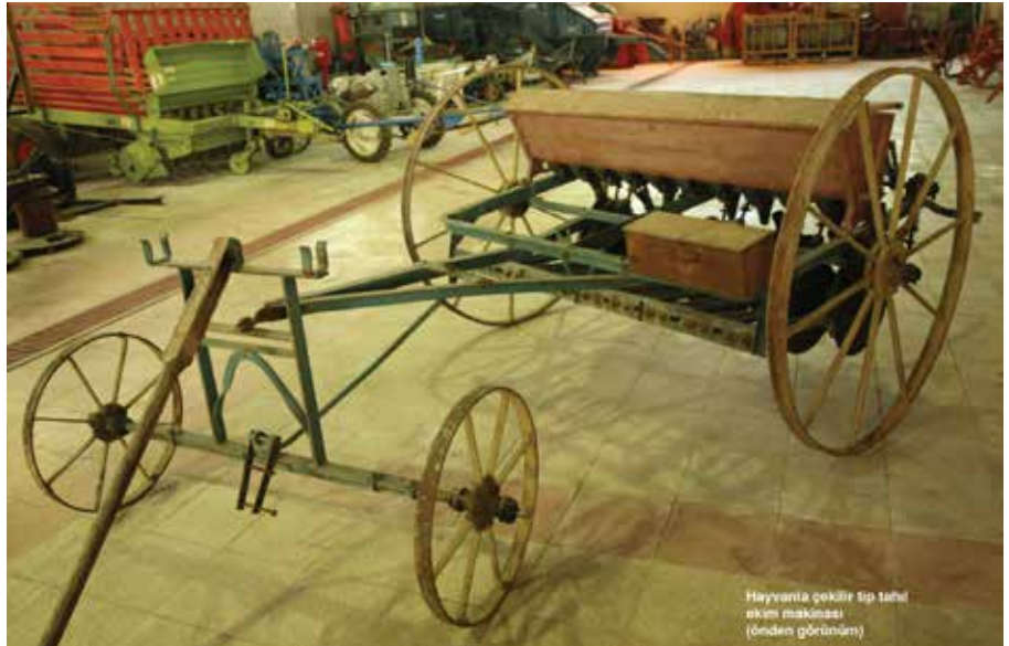
Hayvancılık çökür tip tahıl ekim makinesi (önden görünüm)

Çakmak, müze envanterinde tarımsal işlerde kullanılmış ya da kullanılmakta olan 233 parça makine ve alet bulunduğunu belirtiyor ve “Alanında bu kadar geniş bir yapıya ve varlığa sahip ülkemizdeki tek örnektir. Ve kaynak yetersizliğine rağmen Bölümün özverili çalışmalarıyla hizmete devam etmektedir” diye konuşuyor.