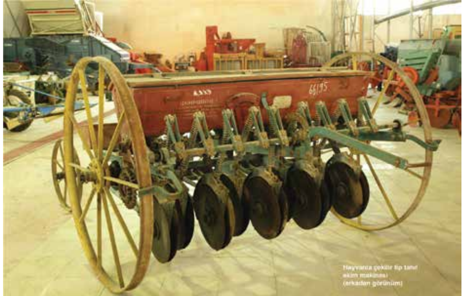
Hayvancılık çökür tip tahıl ekim makinesi (arkadan görünüm)

Neredeyse herkesin ve her kurumun taşın altına elini koymasıyla tamamlanan inşaat ve diğer düzenleme çalışmalarını hemen başlamış ve tam iki yıl sonra da bitirilmişti. Karar verilmesinden 3 yıl, inşaatın başlamasından 2 yıl sonra Türkiye'nin ilk tarım aletleri müzesi, 1984 yılında açılmıştı.