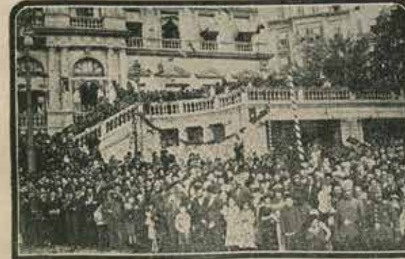
Altıncı Daire önünde: Mes'ud İstanbullulardan bir kısım