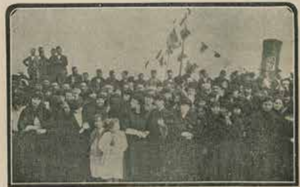
İstanbul halkında heyecan tezâhüratı: Köprü üstünde