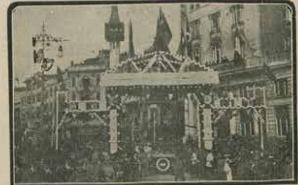
Heyecan tezâhüratından: Karaköy'de sevinç mahşeri