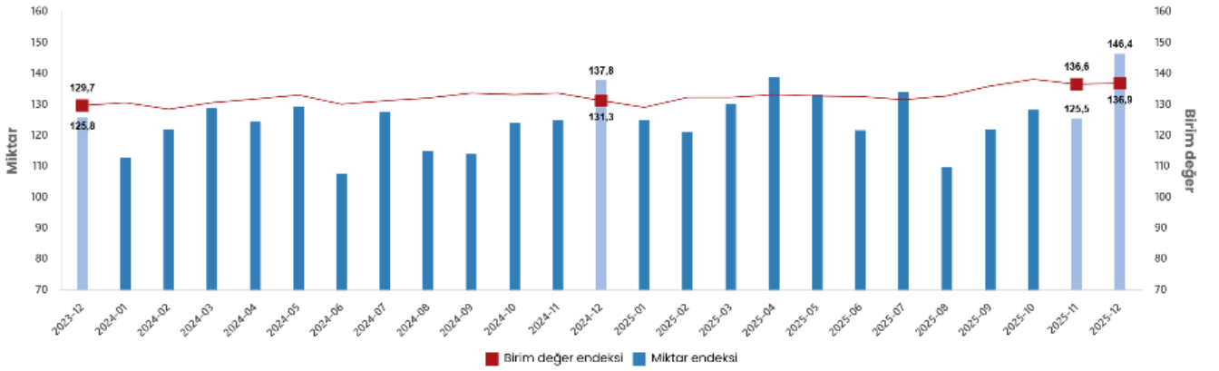
İthalat birim değer ve miktar endeksleri, Aralık 2025 [2015=100]

İthalat miktar endeksi Aralık ayında bir önceki yılın aynı ayına göre %6,3 arttı. Endeks bir önceki yılın aynı ayına göre, gıda, içecek ve tütünde %35,1 arttı, ham maddelerde (yakıt hariç) %9,4 arttı, yakıtlarda %1,2 azaldı, imalat sanayinde (gıda, içecek, tütün hariç) %11,3 arttı.