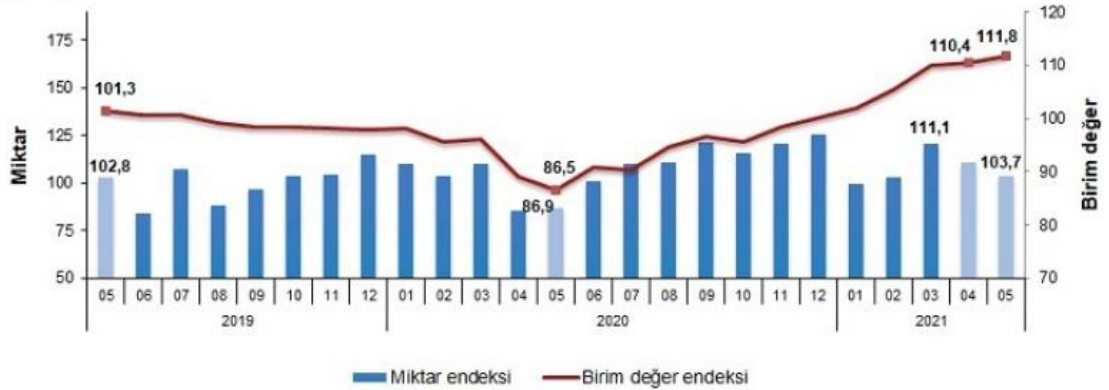
İthalat birim değer ve miktar endeksleri, Mayıs 2021 [2015=100]

İthalat miktar endeksi Mayıs ayında bir önceki yılın aynı ayına göre %19,3 arttı. Endeks bir önceki yılın aynı ayına göre, gıda, içecek ve tütünde %34,7 azalırken, ham maddelerde (yakıt hariç) %10,4, yakıtlarda %21,9 ve imalat sanayinde (gıda, içecek, tütün hariç) %40,0 arttı.